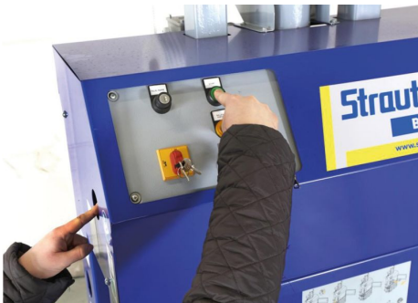
Az egyszerű és biztonságos működést biztosító vezérlőrendszer kész bála és szervíz-visszajelzéssel

BalePress 6S opció: Igény esetén BalePress 4 bálázógépünk rendelhető dupla préslap-megvezetésű kivitelben 2,2 kW teljesítményű motorral 60 kN préserővel. Kifejezetten ajánlott erősebb vastagabb kartonok és vastag mezőgazdasági jellegű fólia bálázása esetén.