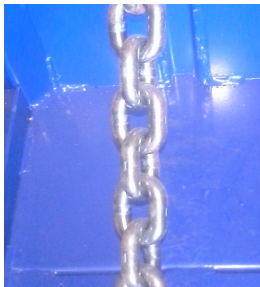
Automatikus, láncos bálakidobás