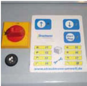
Az egyszerű és biztonságos működést biztosító vezérlőrendszer kész bála és szerviz-visszajelzéssel

A kamra speciális belső kialakítása és a leszorító fogak meggátolják a tömörített anyag visszatágulását - így maximális térfogat csökkenés érhető el.