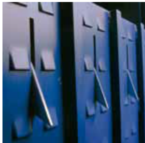
A speciális kamrakialakítás részét képező leszorító fogak meggátolják a préselt anyag visszatágulását